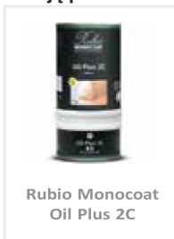
Rubio Monocoat Oil Plus 2C

Norėdami gauti daugiau informacijos, žiūrėkite ant pakuotės ir saugos duomenų lapą.